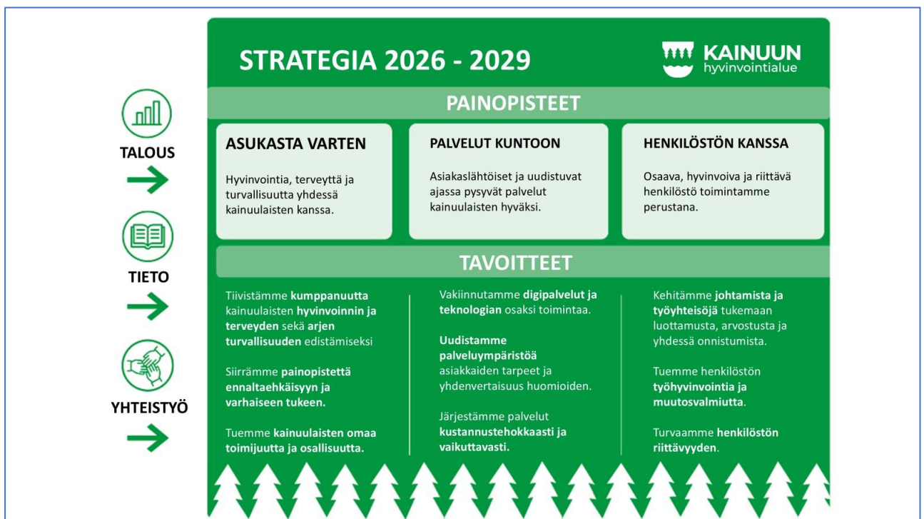
Kuva 1. Kainuun hyvinvointialueen strategia 2026–2029

Kunkin painopisteen alle on määritelty strategiset tavoitteet , jotka konkretisoivat, mitä hyvinvointialueen tulee strategiakauden aikana saavuttaa. Strategiset tavoitteet ovat tämän kauden tärkeimmät yhteiset keinot, jotka suuntaavat toiminnan kehittämistä koko hyvinvointialueella.